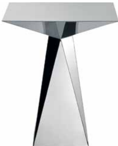
El coffee table Oyster es un diseño de Marco Zanuso Jr. para la firma Driade . Disponible en Palacios .