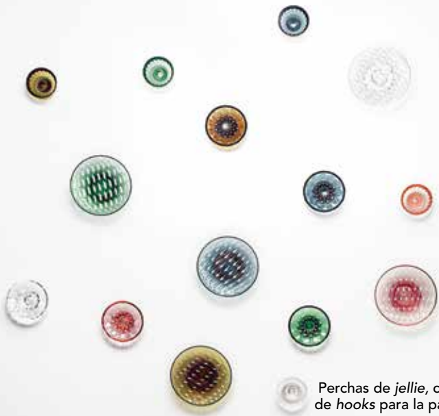
Perchas de jellie , colección de hooks para la pared con patrones y texturas. Diseños de Patricia Urquiola para Kartell . De Palacios .