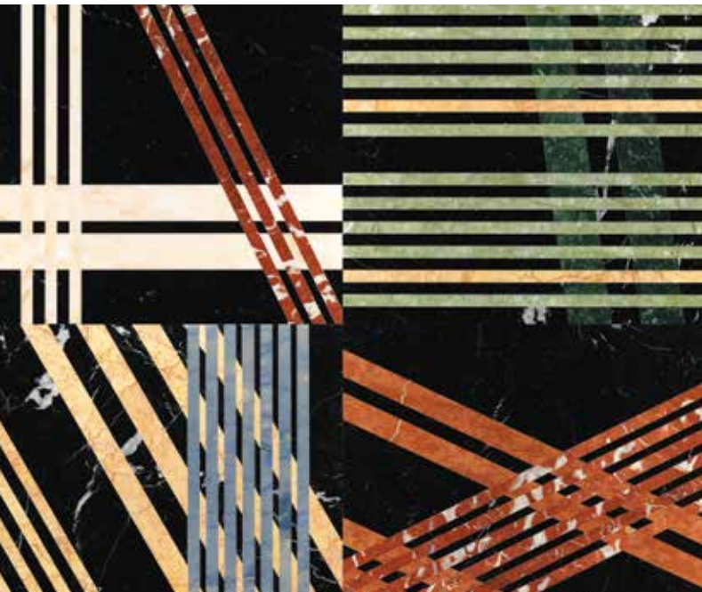
La losa de mármol Mikado de la colección Opus , de Lithos Design , mezcla color, energía y elegancia sofisticada. Se consigue en The Marble Shop .