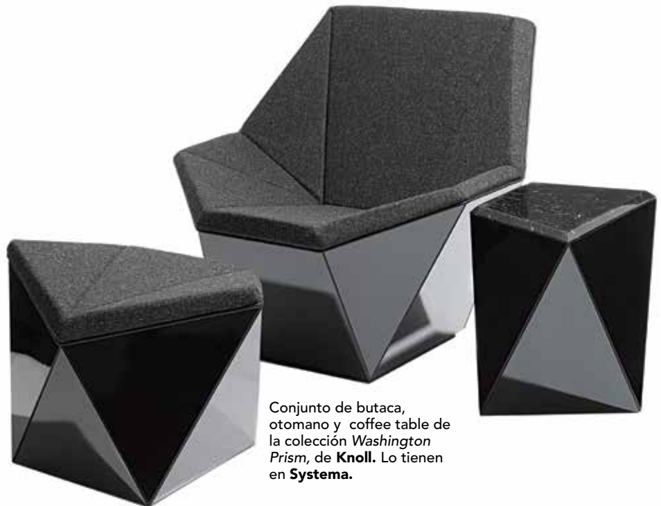
Conjunto de butaca, otomano y coffee table de la colección Washington Prism , de Knoll . Lo tienen en Systema .