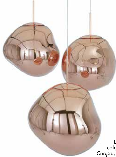
La lámpara colgante Melt Cooper , diseño de Tom Dixon , la tienen en XI:XI Casa .