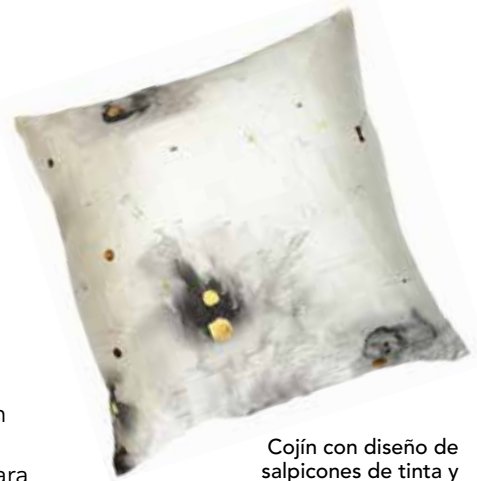
Cojín con diseño de salpicones de tinta y toque metálicos. Completamente hecho a mano. Disponible en XI:XI Casa .