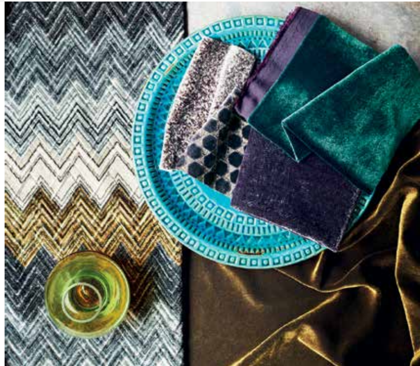
Zenith es una opulenta colección de tejidos que fusiona diseños aterciopelados, llenos de textura y efectos metálicos. Disponibles en DDC Yañez Díaz .

Las piezas de cristal o acrílico con toques de metal y el mármol se combinan para añadir elegancia a cualquier espacio.