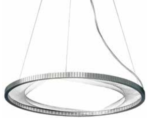
Lámpara colgante con iluminación LED. Cuenta un anillo exterior y cientos de hebras de acero inoxidable ensartadas que crean un interesante patrón. De Luminati .