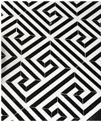
Estampados gráficos y formas geométricas con gran calidad arquitectónica llegan para añadir personalidad y un look moderno y fresco a tus espacios.