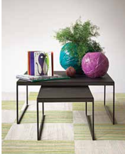
Partiendo de los diseños clásicos de los patrones Missoni, alfombra de la colección Bolon by Missoni. Disponible en FloorCon .