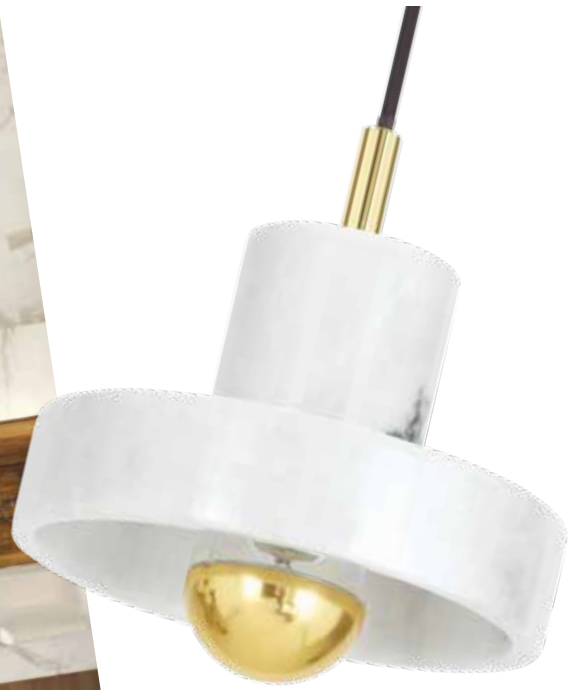
Tradición milenaria. Lámpara colgante y bandeja de servicio de la colección Stone, del legendario diseñador Tom Dixon. De XI:XI Casa.