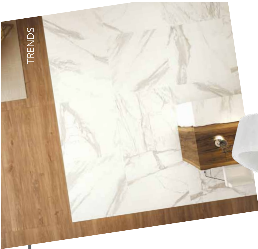
Combo. Combinación de losas para el piso de madera y mármol. Encuéntralas en The Home Warehouse.